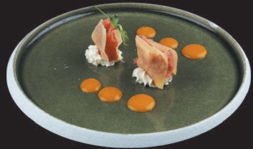
72. Tuna €4,50 tonno, philadelphia, teriyaki, salsa verde