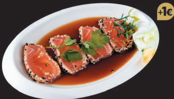
21. Salmone €8,00 filetti di salmone scottato, salsa sesamo e salsa teriyaki