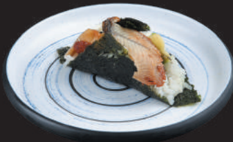
63. Unagi €4,00 anguilla