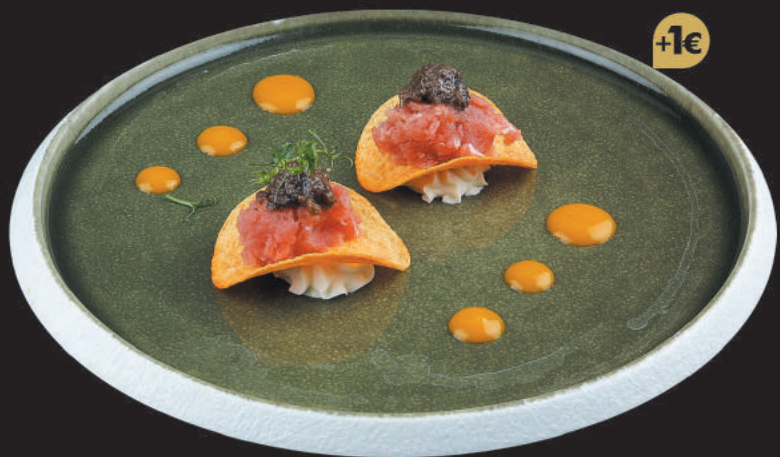
75. Crispy Tuna €4,50 tartare di tonno, philadelphia, tartufo