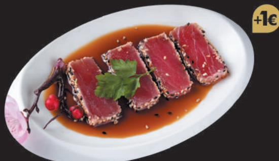
22. Tonno €9,00 filetti di tonno scottato, salsa sesamo e salsa teriyaki