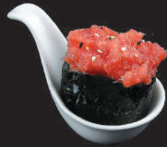
44. Tuna €3,50 tonno