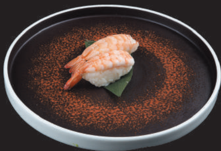
33. Gambero Cotto €3,00 gambero cotto