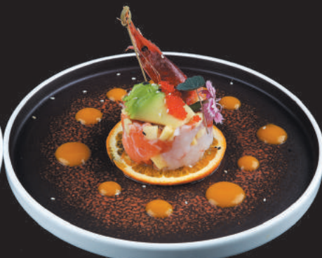
2. Tartare di Yuki €10,00

pesce misto con frutta di stagione, avocado, salsa chef