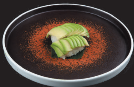
36. Avocado €2,50 avocado