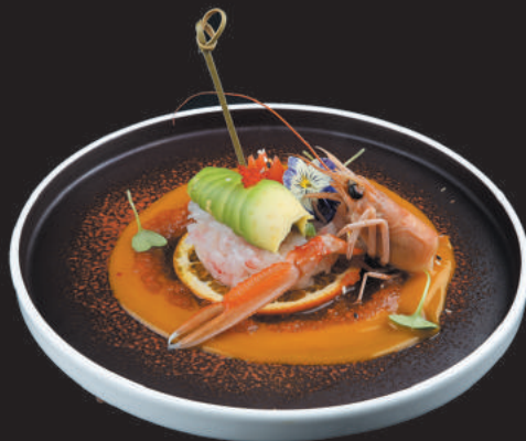
1. Tartare di Gamberi €12,00

N.B. È POSSIBILE ORDINARE QUESTI PIATTI SPECIAL NEL MENÙ CENA SI PUÒ SCEGLIERE SOLO 1 PORZIONE PER OGNI PIATTO