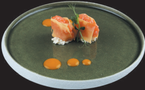
71. Sake €4,50 salmone, mango, philadelphia, teriyaki