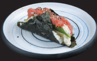
58. Tuna €3,50 tonno, avocado