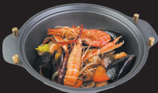
4. Fantasia di Mare €18,00

pesce misto, gamberi rossi, salsa speciale yogurt