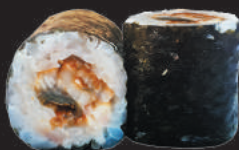
70. Unagi €6,00 anguilla