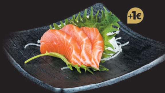
19. Sake €6,00 filetti di salmone