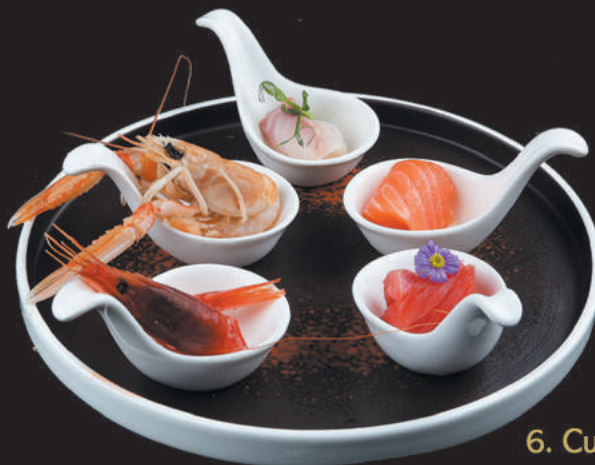
6. Cucchiai misti €9,00

gamberone, scampo, gambero, cozze, vongole, surimi, calamaro, peperoni, funghi cinesi, cipolla, porro, piccante