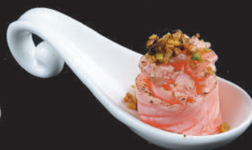
54. Sakè Flambè €6,00 salmone flambè, teriyaki, pistacchio, piccante