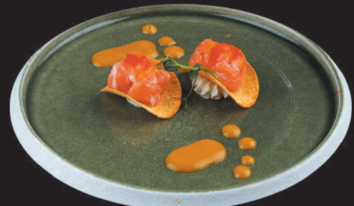
74. Crispy Sake €4,50 tartare di salmone, philadelphia, tobiko, mango