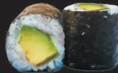
67. Avocado €4,00 avocado