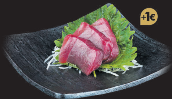
20. Tuna €7,00 filetti di tonno