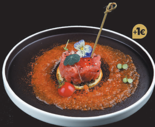
16. Tartare di Tonno €10,00 tonno, salsa chef, sesamo