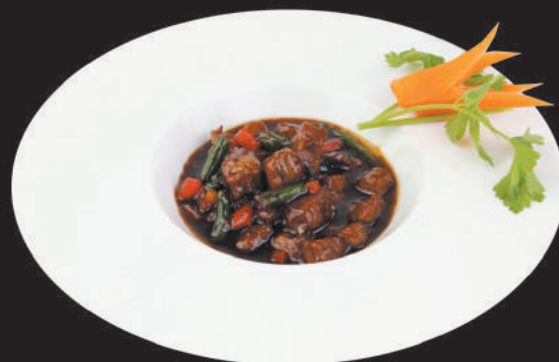
258 VITELLO CON ASPARAGI

vitello, asparagi, cipolla, peperoni, salsa yuki n.3