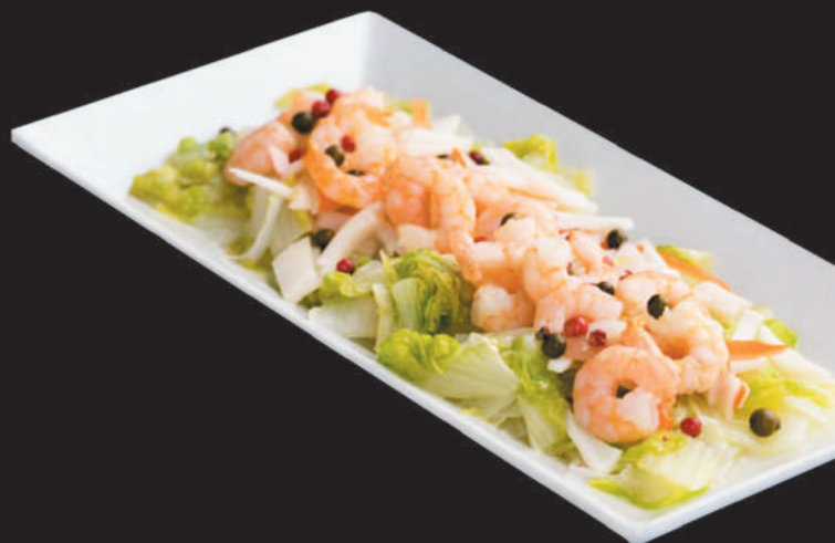
277 Insalata mista €5,00 polpo, gamberi, surimi, lattuga, mais, carote, salsa frutta