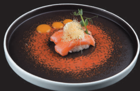
39. Sake Philadelphia €4,00 salmone, philadelphia, kataifi