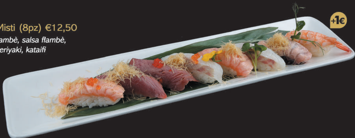
42. Flambè Misti (8pz) €12,50 nigiri misti flambè, salsa flambè, salsa teriyaki, kataifi