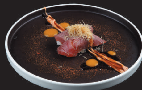
38. Tuna Flambè €4,00 tonno flambè con salsa flambè, teriyaki e kataifi