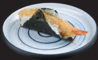
61. Ebiten €3,50 gamberone fritto