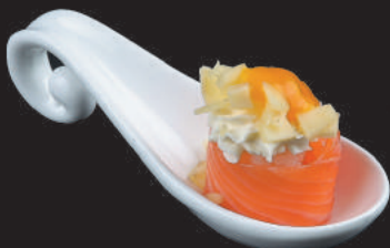
53. Sake Mango €5,50 philadelphia, mango