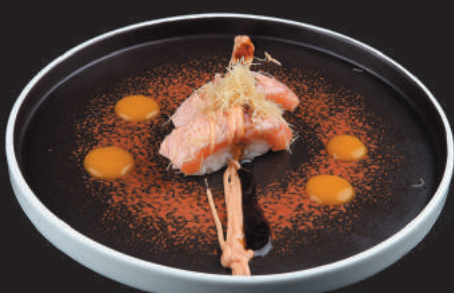
37. Sake Flambè €4,00 salmone flambè con salsa flambè, teriyaki e kataifi