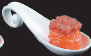
50. Tuna €5,50 tonno