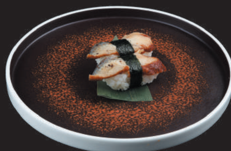
35. Anguilla €4,00 anguilla con salsa teriyaki