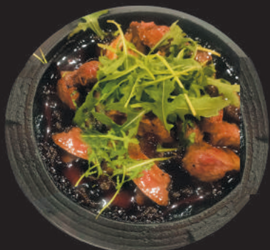
5. Tagliata di Manzo €10,00

salmone, tonno, orata, gambero rosso, scampo