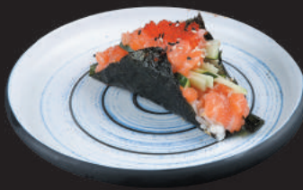
59. Spicy Sake €3,50 salmone spicy, cetriolo, tobiko