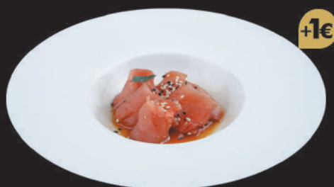
18. Carpaccio di Tonno €7,00 tonno, salsa ponzu, sesamo