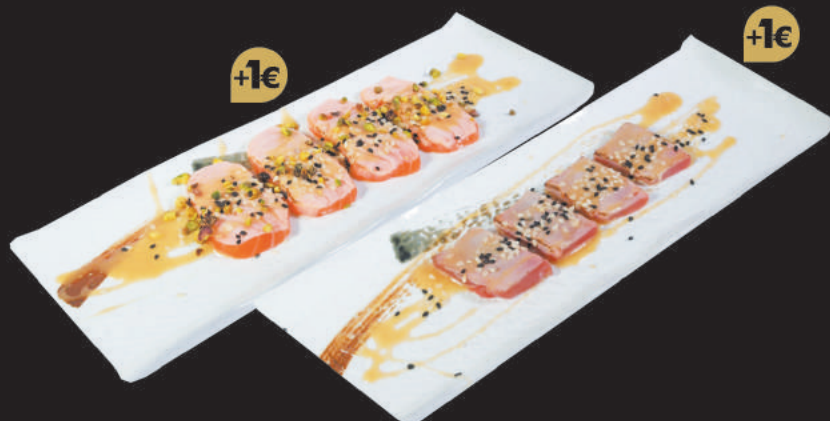
24. Maguro Special €11,00 tonno scottato, salsa burro di arachidi, pistacchio