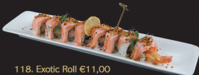
118. Exotic Roll €11,00 tempura di gamberi avvolto da salmone flambè, salsa rossa, teriyaki pistacchio