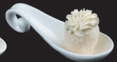
56. Nido Phila €4,00 philadelphia, salsa teriyaki