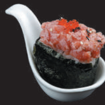
45. Sake Cotto €3,00 salmone cotto, salsa spicy