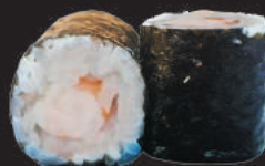
66. Ebi €4,50 gamberi