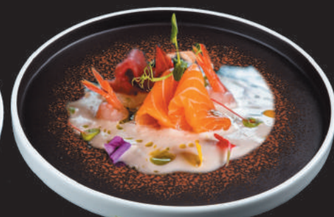
3. Sashimi Special €10,00

pesce misto con frutta di stagione, avocado, salsa chef