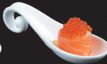
51. Ikura €6,00 uova di salmone