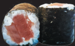
65. Tuna €5,50 tonno