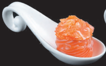
49. Sake €5,50 salmone