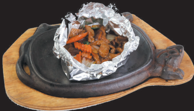
257 VITELLO CON PATATE