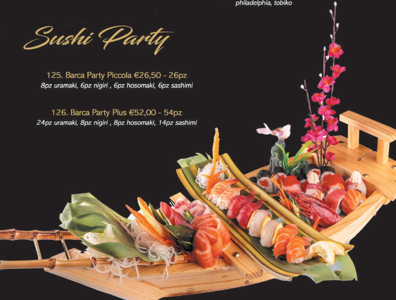
126. Barca Party Plus €52,00 - 54pz 24pz uramaki, 8pz nigiri , 8pz hosomaki, 14pz sashimi