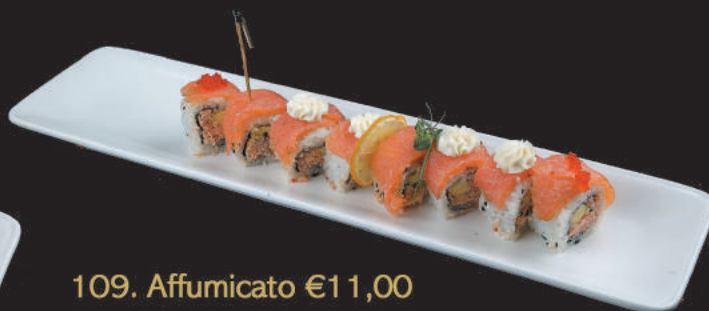
109. Affumicato €11,00 salmone cotto, philadelphia, avocado, teriyaki