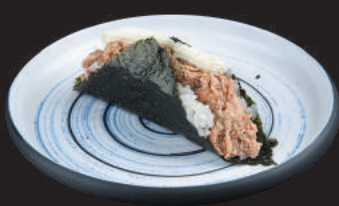
61. Gambero Cotto €3,50 gamberi cotti