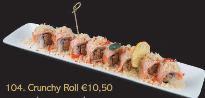
104. Crunchy Roll €10,50 salmone, avocado avvolto da salmone flambè, tempura, salsa verde e teriyaki