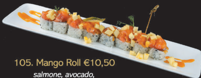
105. Mango Roll €10,50 salmone, avocado, esterno tartare di salmone, mango e salsa mango