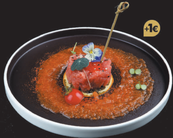
10. Tartare di Tonno €10,00 tonno, salsa chef, sesamo