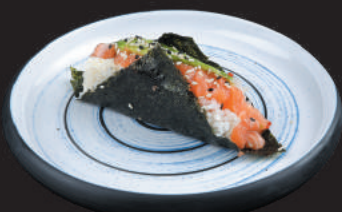
56. Sake €3,50 salmone, avocado