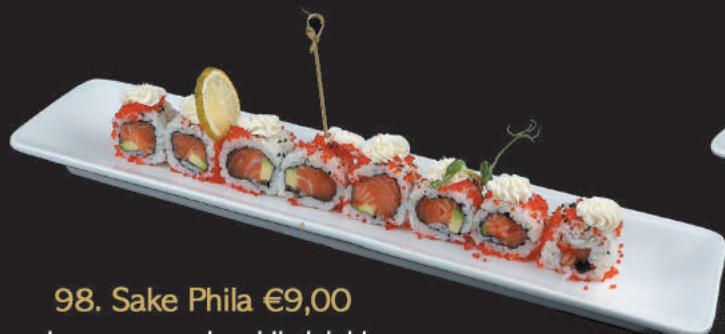
98. Sake Phila €9,00 salmone, avocado, philadelphia, tobiko