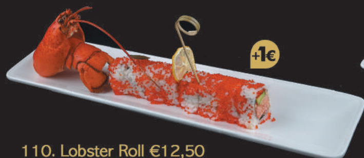
110. Lobster Roll €12,50 astice, avocado, maionese, tobiko, salsa mango