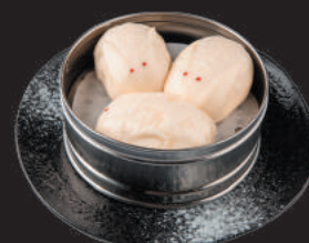
A7. PANE DI CONIGLIO