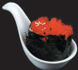
45. Tobiko €5,00 tobiko