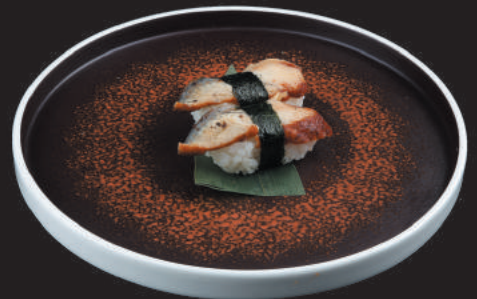
33. Anguilla €4,00 anguilla con salsa teriyaki