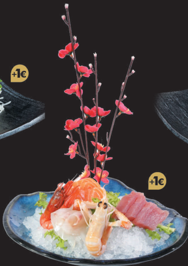
17. Tuna €7,00 filetti di tonno