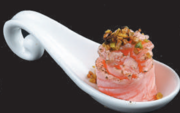
53. Sakè Flambè €6,00 salmone flambè, teriyaki, pistacchio, piccante