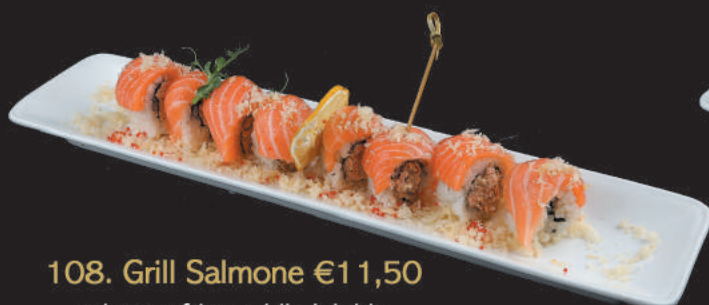
108. Grill Salmone €11,50 salmone fritto, philadelphia, tempura, avvolto da salmone teriyaki