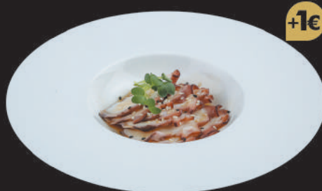
14. Carpaccio di Polpo €5,50 polpo, sesamo