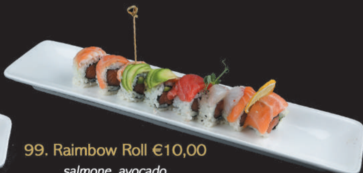
99. Rainbow Roll €10,00 salmone, avocado avvolto da pesce misto, salsa verde e teriyaki