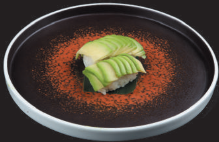
34. Avocado €2,50 avocado