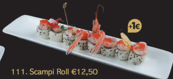
111. Scampi Roll €12,50 salmone avocado, tartare di scampi, tobiko, salsa chef