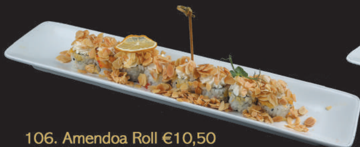
106. Amendoa Roll €10,50 salmone, avocado, philadelphia, mandorle, teriyaki