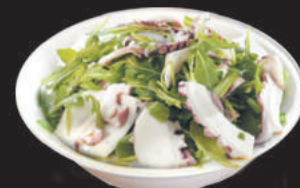
A102. POLPO E RUCOLA