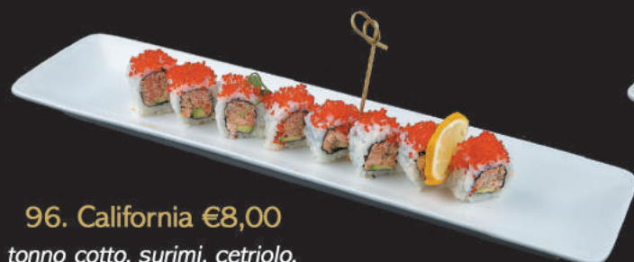
96. California €8,00 tonno cotto, surimi, cetriolo, avocado, maionese