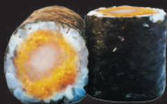
68. Gambero Fritto €5,00 gambero fritto