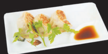
A10. RAVIOLI BRASATI