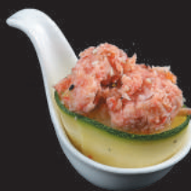
47. Zucchina €3,50 surimi, maionese, zucchina