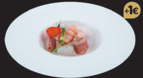
13. Carpaccio Flambè €7,00 pesce misto flambè