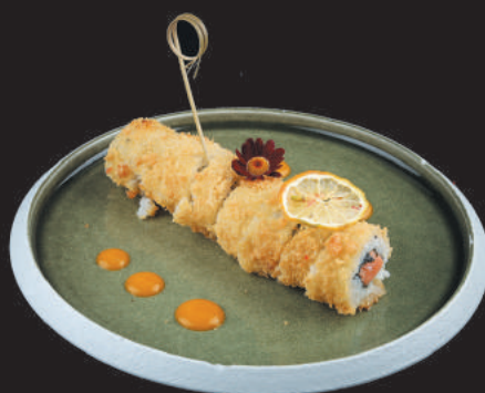
92. Ura Fritto €8,50 salmone, avocado, philadelphia