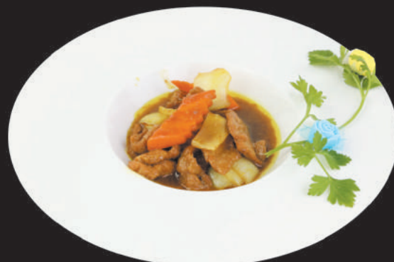
A56 VITELLO AL CURRY