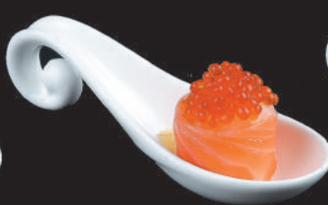
50. Ikura €6,00 uova di salmone