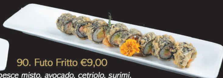
90. Futo Fritto €9,00 pesce misto, avocado, cetriolo, surimi, gamberi cotti, tobiko, philadelphia