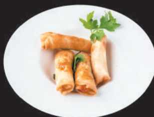
A2. INVOLTINI DI GAMBERI