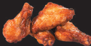
A17. ALETTE DI POLLO