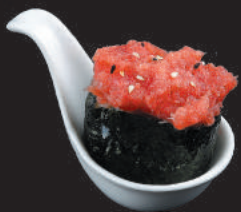
42. Tuna €3,50 tonno