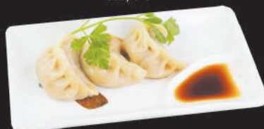
A9. RAVIOLI AL VAPORE