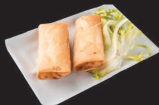
A1 INVOLTINI PRIMAVERA