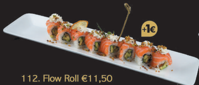
112. Flow Roll €11,50 fiori di zucca, avocado, philadelphia, avvolto da salmone teriyaki, pistacchio