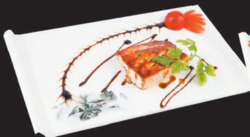
A72 Salmone alla piastra €8,00 salmone, teriyaki, sesamo