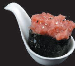
44. Tuna Cotto €3,00 tonno cotto, salsa spicy