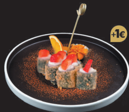
93. Sake Fritto €8,50 philadelphia, teriyaki, frutta di stagione