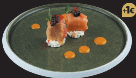
76. Tartufo €5,50 tartufo misto