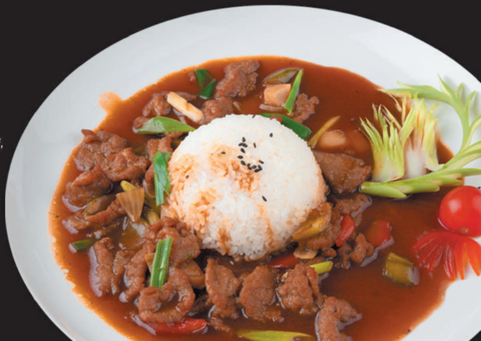
A59 VITELLO CON RISO riso, vitello, asparagi, cipolla, peperoni, salsa yuki n3 €7,00