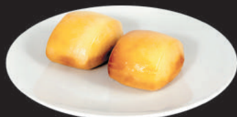
A8. PANE FRITTO CINESE