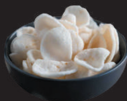
A4 NUVOLETTE DI GAMBERI