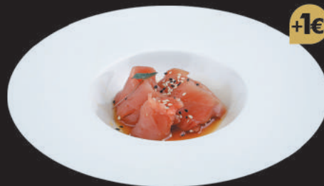
12. Carpaccio di Tonno €7,00 tonno, salsa ponzu, sesamo