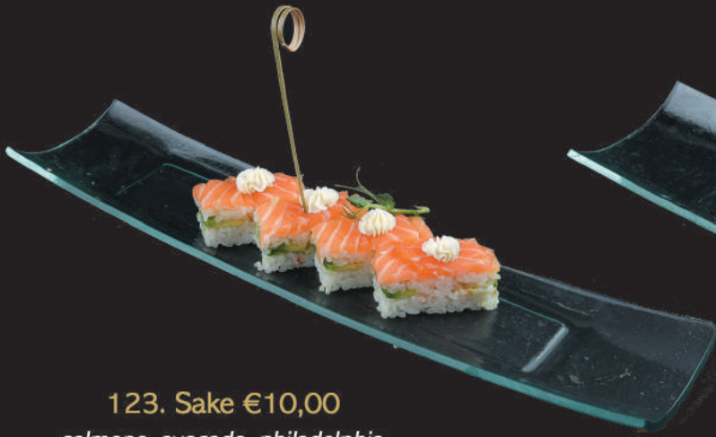
123. Sake €10,00 salmone, avocado, philadelphia