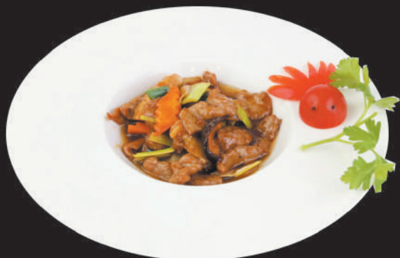
A54 VITELLO CON FUNGHI E BAMBÙ

vitello, funghi, bambù, carote, cipolla, porro