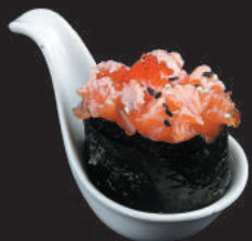
41. Sake €3,50 salmone