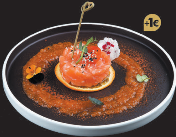
9. Tartare di Salmone €9,00 salmone, salsa chef, sesamo

I PIATTI CONTRASSEGNA TI DAL SIMBOLO +1€ PUOI ORDINARLI 1 VOLTA NEL MENÙ PRANZO. LE VOLTE SUCCESSIVE AVRANNO UN COSTO DI €1 A PORZ. NEL MENÙ CENA SONO ILLIMITATE.