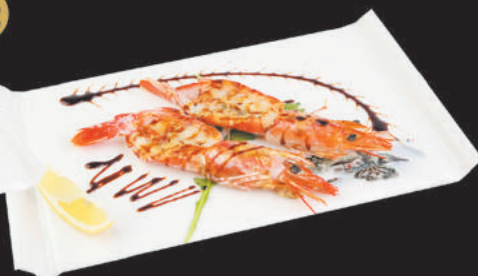
A74 Gamberoni alla piastra €7,00 gamberoni, teriyaki, sesamo