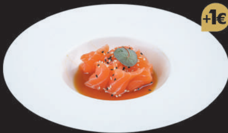
11. Carpaccio di Salmone €6,00 salmone, salsa ponzu, sesamo