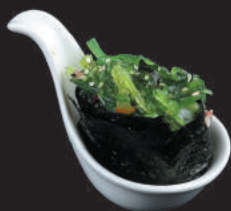
46. Wakame €3,00 wakame