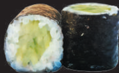
67. Cetriolo €4,00 cetriolo