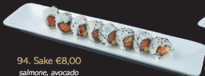
94. Sake €8,00 salmone, avocado