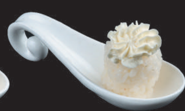
55. Nido Phila €4,00 philadelphia, salsa teriyaki