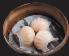
A11. RAVIOLI DI GAMBERI