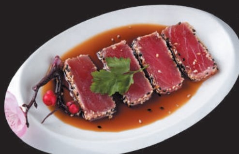
19. Salmone €8,00 filetti di salmone scottato, salsa sesamo e salsa teriyaki