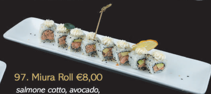
97. Miura Roll €8,00 salmone cotto, avocado, philadelphia, teriyaki, kataifi