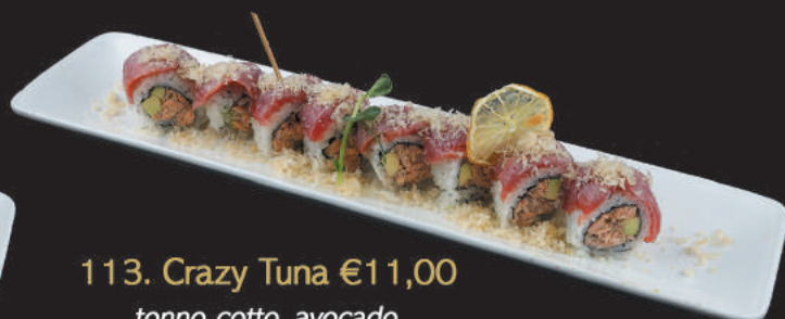
113. Crazy Tuna €11,00 tonno cotto, avocado avvolto da tonno flambè, erba cipollina, maionese, salsa teriyaki