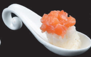
54. Nido Sake €4,50 salmone, salsa teriyaki