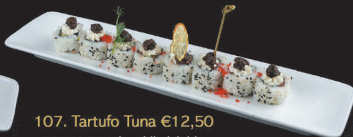
107. Tartufo Tuna €12,50 tonno, avocado, philadelphia, tartufo