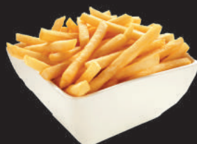
A5. PATATINE FRITTE