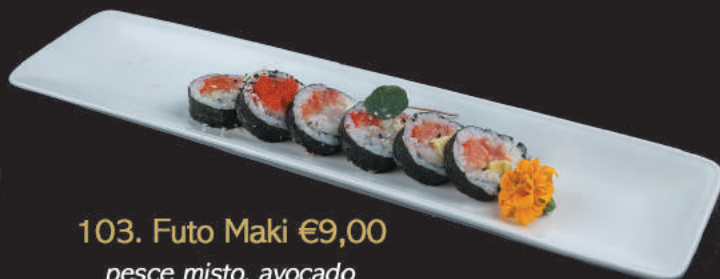
103. Futo Maki €9,00 pesce misto, avocado