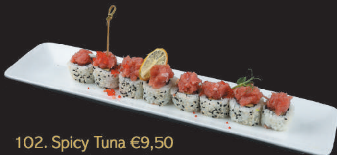
102. Spicy Tuna €9,50 tonno spicy, avocado