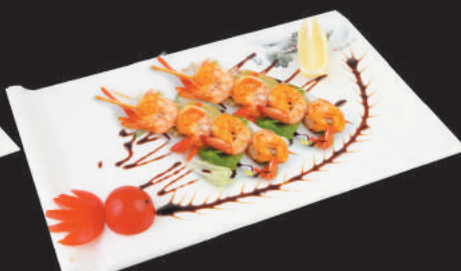
A14 Spiedini di Gamberi €5,00 2pz