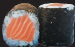
63. Sake €5,50 salmone