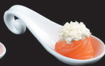
51. Philadelphia €5,00 philadelphia