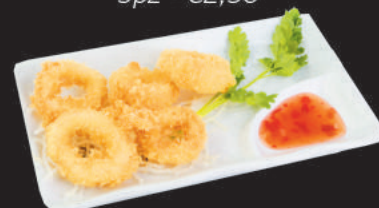
A18. ANELLI DI CALAMARO