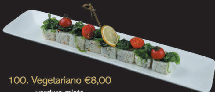
100. Vegetariano €8,00 verdure miste