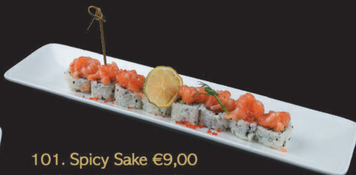
101. Spicy Sake €9,00 salmone spicy, avocado