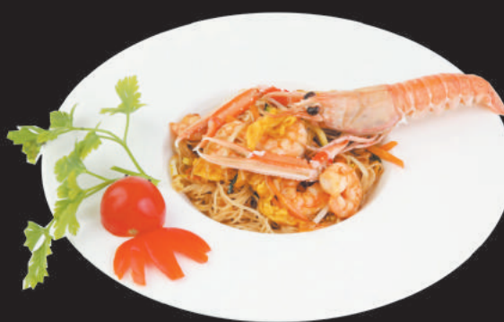
A31 Spaghetti di riso saltati € 3,50

salsa yuki n3, zucchine, carote, cipolla, porro, germogli di soia, gamberi