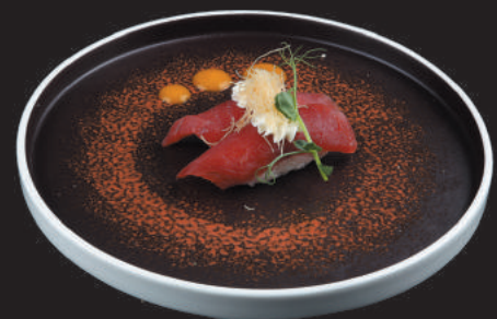
38. Tonno Philadelphia €4,00 tonno, philadelphia, kataifi