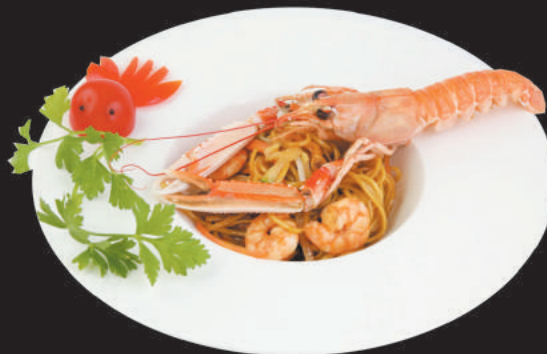
A24 Spaghetti saltati con Gamberi €5,00

gamberi, surimi, calamari, uovo, cipolla, carote, piselli, mais