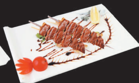
A80 Spiedini di Vitello €4,00 2pz