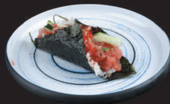
59. Spicy Tuna €3,50 tonno spicy, cetriolo, tobiko