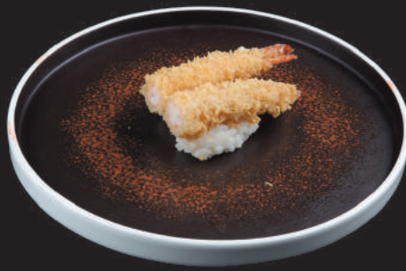
32. Gambero Fritto €3,50 gambero fritto con salsa rossa teriyaki