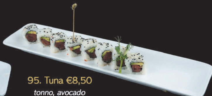
95. Tuna €8,50 tonno, avocado