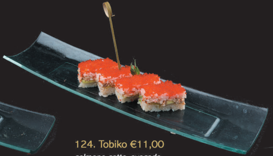
124. Tobiko €11,00 salmone cotto, avocado, philadelphia, tobiko