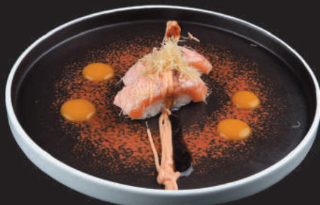
35. Sake Flambè €4,00 salmone flambè con salsa flambè, teriyaki e kataifi