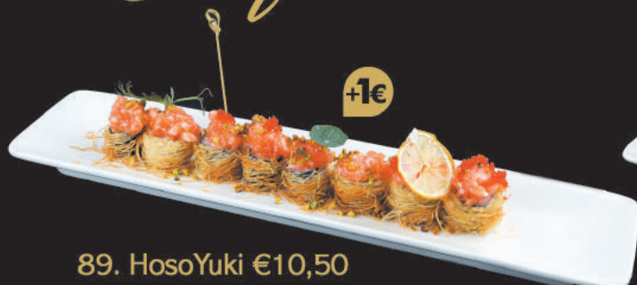
89. Hosoyuki €10,50 tartare di salmone, avocado, kataifi, pistacchio, tobiko, salsa chef