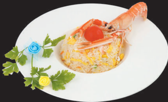
A20 Riso Cantonese €3,50