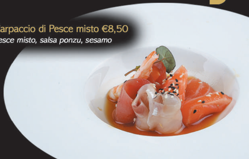
15. Carpaccio di Pesce misto €8,50 pesce misto, salsa ponzu, sesamo