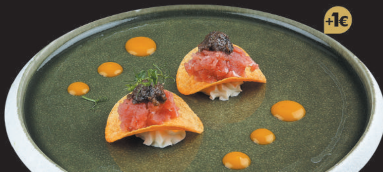
78. Crispy Tuna €4,50 tartare di tonno, philadelphia, tartufo