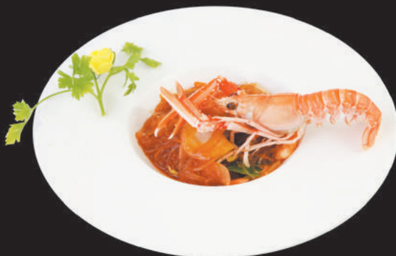
A27 Spaghetti di soia piccanti €3,50

gamberi, surimi, calamari, uovo, cipolla, carote, porro, zucchine, germogli di soia