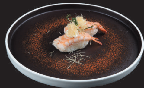
39. Gamberi Philadelphia €4,00 gambero cotto, philadelphia, kataifi