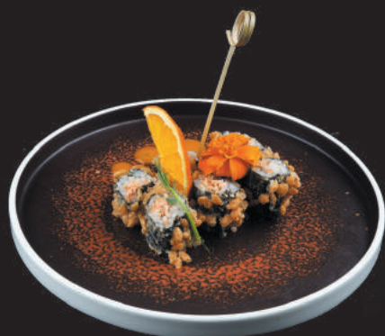
91. PopCorn Sake €8,00 salmone, salsa rossa teriyaki