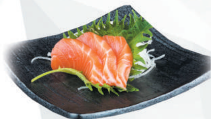
69.SAKE salmone €6,00 ALLERGENI 4

FILETTI DI PESCE 3pz - menù alla carta 6pz | Pranzo solo 1 porzione per persona