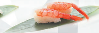
33.GAMBERO CRUDO gambero rosso crudo €3,50 ALLERGENI 2