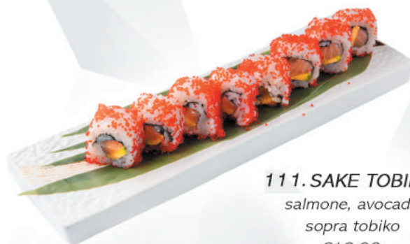
111.SAKE TOBIKO salmone, avocado sopra tobiko €12,00 ALLERGENI 4,11