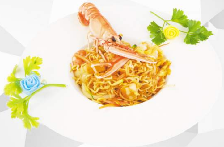
237 RAMEN PIASTRA zucchine, carote, cipolla, porro, gamberi, calamari, surimi, uovo €6,00 ALLERGENI 1,2,3,6,14