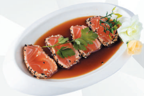
77.SALMONE filetti di salmone scottato, sesamo, salsa ponzu €8,00 ALLERGENI 1,4,6,11

FILETTI DI PESCE SCOTTATI CON SESAMO 4pz - menù alla carta 6pz | Pranzo solo 1 porzione per persona