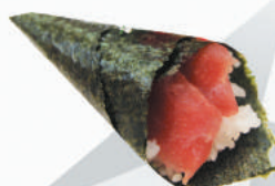
44.TONNO tonno, avocado, sesamo €3,00 ALLERGENI 4,11