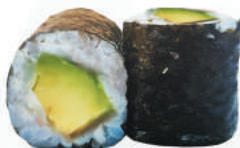
99.AVOCADO avocado €3,50