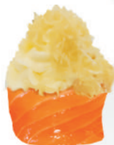
63.PHILA KATAIFI philadelphia, kataifi avvolto da salmone, €5,00 ALLERGENI 1,4,7