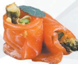
64.SAKE ASPARAGI asparagi, avvolto da salmone, teriyaki €4,50 ALLERGENI 1,4,6