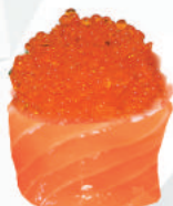
59. TOBIKO tobiko, avvolto da salmone €4,50 ALLERGENI 4