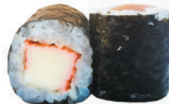
97.KANIKAMA surimi di granchio €4,00 ALLERGENI 1,2