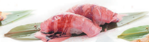
39.TONNO SCOTTATO tonno scottato, teriyaki €3,50 ALLERGENI 1,4,6