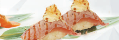
41.TONNO KATAIFI tonno scottato, philadelphia, kataifi, teriyaki €4,50 ALLERGENI 1,4,6,7