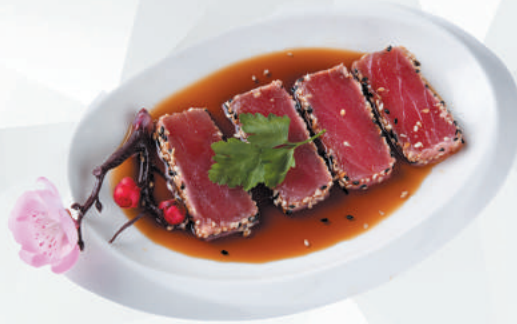
78.TONNO filetti di tonno scottato, sesamo, salsa ponzu €9,00 ALLERGENI 1,4,6,11

*PESCE FRESCO MA CONGELATO SECONDO TERMINI DI LEGGE