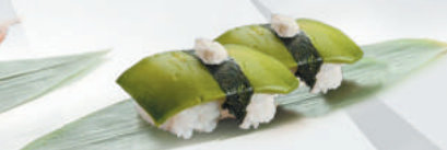
37.AVOCADO avocado €2,50 ALLERGENI 7