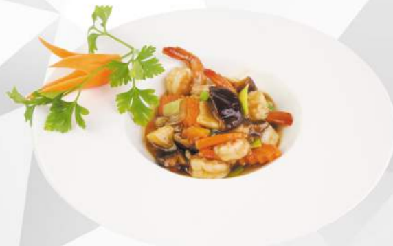
268 GAMBERI FUNGHI E BAMBÙ gamberi, funghi, bambù €6,00 ALLERGENI 1,2,6