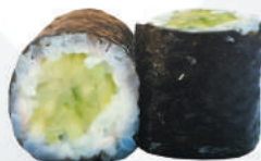
100.KAPPA cetrioli €4,00