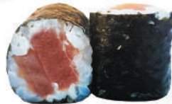
96.TEKA tonno €4,00 ALLERGENI 4