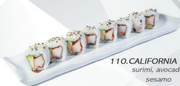
110.CALIFORNIA ROLL surimi, avocado, sesamo €8,50 ALLERGENI 1,11