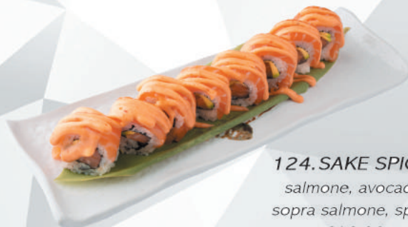
124.SAKE SPICY salmone, avocado sopra salmone, spicy €12,00 ALLERGENI 1,4