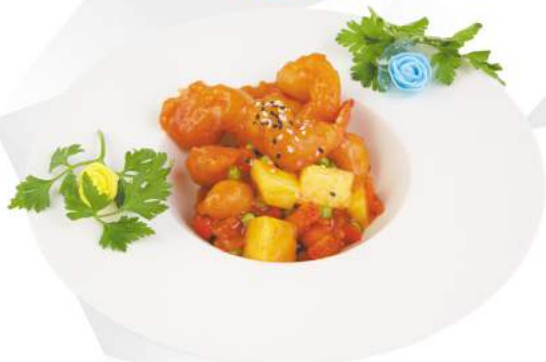
269 GAMBERI IN AGRODOLCE gamberi fritti, ananas, peperoni, piselli, salsa agrodolce €6,50 ALLERGENI 1,2,11