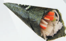
48.SURIMI surimi, avocado, sesamo €3,00 ALLERGENI 1,2,11