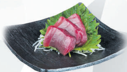
70.TUNA tonno €7,00 ALLERGENI 4