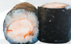
101.EBI gambero cotto €4,00 ALLERGENI 1,2