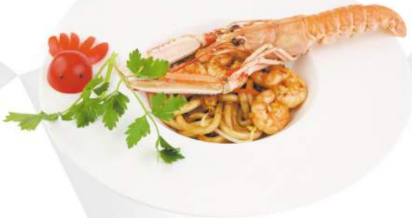
238 YAKI UDON zucchine, carote, cipolle, porro, uovo, gamberi €8,00 ALLERGENI 1,2,3,6