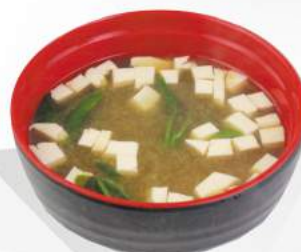
242 ZUPPA DI MISO tofu, alghe, miso €3,00 ALLERGENI 1,6