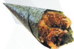
49.SALMONE FRITTO salmone fritto, avocado, philadelphia, teriyaki, sesamo €3,00 ALLERGENI 1,4,6,7,11