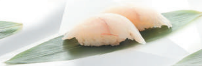
32.ORATA orata €3,00 ALLERGENI 4