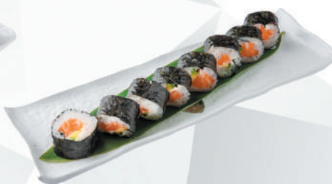
91.SAKE salmone, avocado, philadelphia €9,00 ALLERGENI 4,7