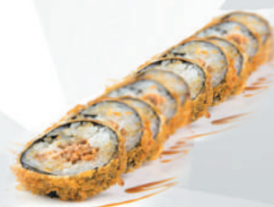
92.FRITTO salmone, avocado, philadelphia, teriyaki €10,00 ALLERGENI 1,4,6,7,11