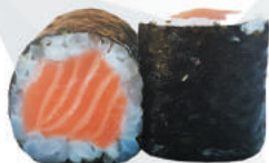
95.SAKE salmone €3,50 ALLERGENI 4

CILINDRI DI RISO CON PESCE RICOPERTI DA ALGA NORI - 6PZ