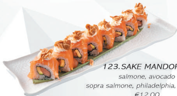
123.SAKE MANDORLA salmone, avocado sopra salmone, philadelphia, mandorle €12,00 ALLERGENI 1,4,7,8