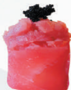
55.MAGURO SPICY tartare di tonno, mayo, tobiko, avvolto da tonno €5,00 ALLERGENI 1,2,4