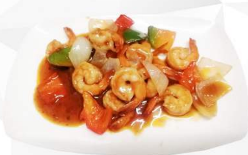
271 GAMBERI IN SALSA PICCANTE gamberi, funghi cinesi, peperoni, cipolla, salsa piccante €6,00 ALLERGENI 1,2,6