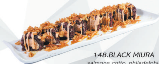
148.BLACK MIURA salmone cotto, philadelphia, sopra cipolla fritta, spicy €11,00