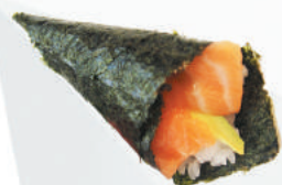
43.SALMONE salmone, avocado, sesamo €2,50 ALLERGENI 4,11

CONO DI ALGA NORI FARCITO CON RISO E PESCE - 1PZ