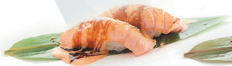
38.SALMONE SCOTTATO salmone scottato, teriyaki €3,00 ALLERGENI 1,4,6