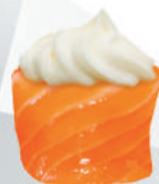
56.PHILADELPHIA philadelphia, avvolto da salmone €5,00 ALLERGENI 4,7