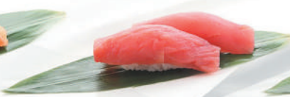
31.TONNO tonno €3,00 ALLERGENI 4