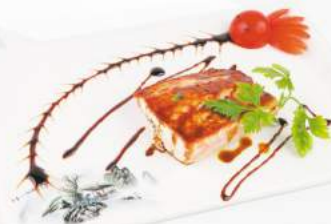
274 Salmone alla piastra €8,00 salmone, teriyaki, sesamo Pranzo solo 1 porzione per persona ALLERGENI 1,4,6,11