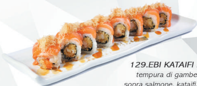
129.EBI KATAIFI ROLL tempura di gamberoni, sopra salmone, kataifi, teriyaki €11,00 ALLERGENI 1,2,6