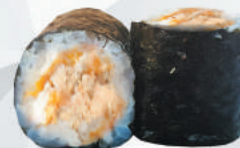
102.MIURA salmone cotto, teriyaki €4,00 ALLERGENI 1,4,6