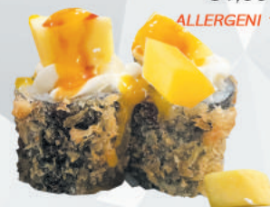
105.FRUIT salmone, philadelphia, teriyaki tutto in tempura con frutta, salsa mango €5,00 ALLERGENI 1,4,6,7