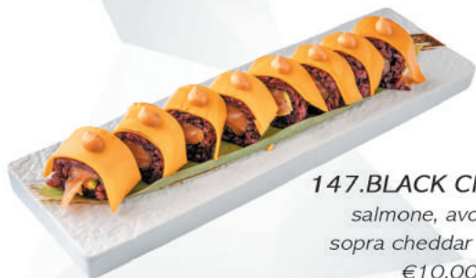
147.BLACK CHEDDAR salmone, avocado sopra cheddar e spicy €10,00