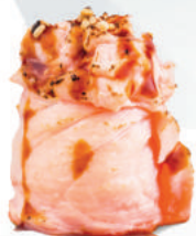
62.SAKE SCOTTATO tartare di salmone, avvolto da salmone, teriyaki, tutto scottato €6,00 ALLERGENI 1,4,6