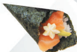
47.SALMONE PHI salmone, avocado, philadelphia, sesamo €3,00 ALLERGENI 4,7,11