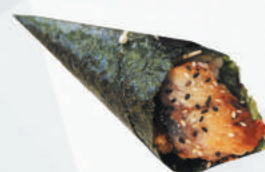
51.ANGUILLA anguilla, philadelphia, teriyaki, sesamo €3,50 ALLERGENI 1,4,6,11

*PESCE FRESCO MA CONGELATO SECONDO TERMINI DI LEGGE