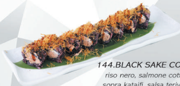
144.BLACK SAKE COTTO riso nero, salmone cotto, sopra kataifi, salsa teriyaki €10,00