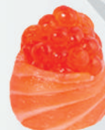
61.IKURA uova di salmone, avvolto da salmone €5,00 ALLERGENI 4