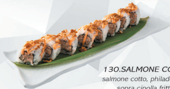
130.SALMONE COTTO salmone cotto, philadelphia sopra cipolla fritta €8,50 ALLERGENI 1,4,7