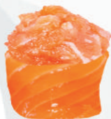
54.SAKE SPICY tartare di salmone, mayo, avvolto da salmone €5,00 ALLERGENI 1,2,4

RISO AVVOLTO DA PESCE GUARNITO SOPRA - 2PZ