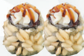
103.CRISPY FRITTO salmone cotto, philadelphia, teriyaki, crispies €5,00 ALLERGENI 1,4,6,7