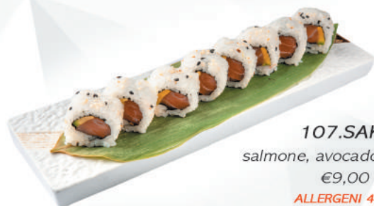
107.SAKE salmone, avocado, sesamo €9,00 ALLERGENI 4,11