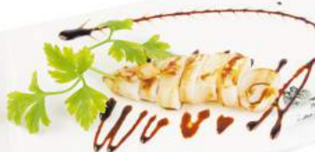
280 Calamaro alla piastra €7,00 calamaro, teriyaki, sesamo Pranzo solo 1 porzione per persona ALLERGENI 1,4,6