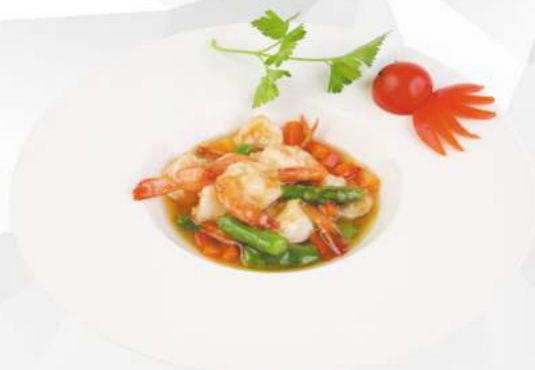
272 GAMBERI CON ASPARAGI gamberi, asparagi, peperoni, cipolla €7,50 ALLERGENI 1,2,6