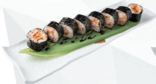
90. EBI gambero in tempura, salsa teriyaki €11,00 ALLERGENI 1,2,6

ROLLS GRANDI RIPIENI DI RISO E PESCE 4pz - menù alla carta 8pz