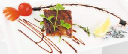
275 Tonno alla piastra €9,00 tonno, teriyaki, sesamo Pranzo solo 1 porzione per persona ALLERGENI 1,4,6,11