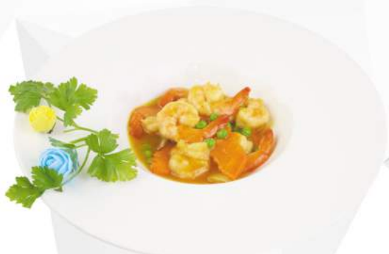
267 GAMBERI AL CURRY gamberi, curry, cipolla, carote €6,00 ALLERGENI 1,2,6