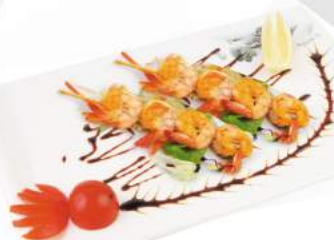
278 Spiedini di Gamberi €5,00 2pz - menù alla carta 3 spiedini ALLERGENI 1,2,6