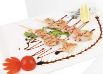
277 Spiedini di Maiale €4,00 2pz - menù alla carta 3 spiedini ALLERGENI 1,6