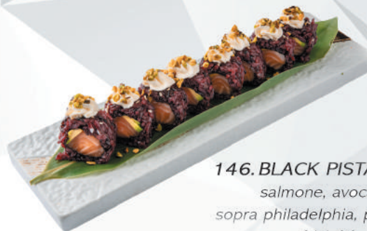
146.BLACK PISTACCHIO salmone, avocado sopra philadelphia, pistacchio €11,00