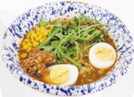
236 RAMEN ZUPPA manzo, mais, rucola, uovo €6,00 ALLERGENI 1,3,6