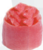
58. MAGURO tartare di tonno, avvolto da tonno €4,50 ALLERGENI 4