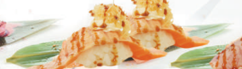
40.SALMONE KATAIFI salmone scottato, philadelphia, kataifi, teriyaki €4,00 ALLERGENI 1,4,6,7