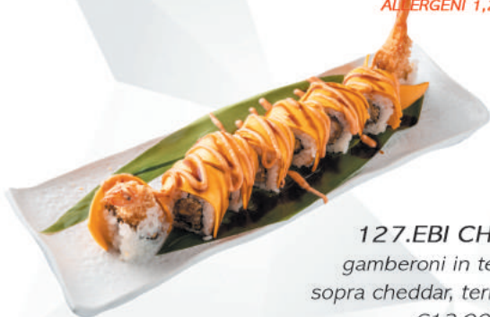
127.EBI CHEESE gamberoni in tempura, sopra cheddar, teriyaki, spicy €12,00 ALLERGENI 1,2,6