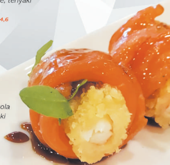
66.SPECIAL YUKI gamberone in tempura, rucola avvolto da salmone, teriyaki €5,00 ALLERGENI 1,2,4,6