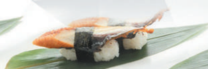
36.ANGUILLA anguilla, teriyaki €4,00 ALLERGENI 1,4,6