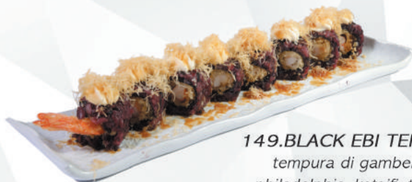
149.BLACK EBI TEMPURA tempura di gamberoni, philadelphia, kataifi, teriyaki €11,00