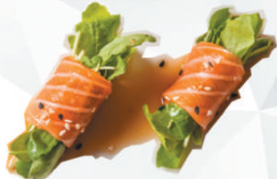
65.ROCKET SAKE rucola, avvolta da salmone in salsa ponzu, sesamo €4,00 ALLERGENI 1,4,6,11