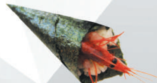
45.GAMBERO CRUDO gambero crudo, avocado, sesamo €3,50 ALLERGENI 4,11