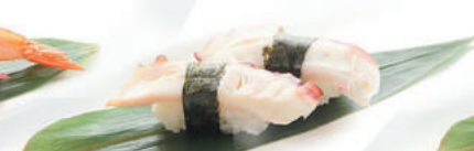
35.POLPO polpo €2,50 ALLERGENI 14