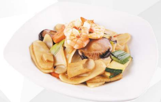
239 GNOCCHI DI RISO carote, zucchine, funghi, cipolla, uova, gamberi €5,00 ALLERGENI 1,2,3,6