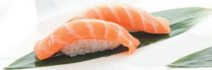
30.SALMONE salmone €2,50 ALLERGENI 4