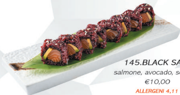
145.BLACK SAKE salmone, avocado, sesamo €10,00