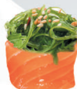
60. WAKAME wakame, avvolto da salmone €4,00 ALLERGENI 4,11