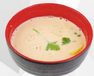
243 ZUPPA THAI gamberi, vongole, branzino, latte di cocco, limone, salsa piccante €6,00 ALLERGENI 1,2,4,7,14