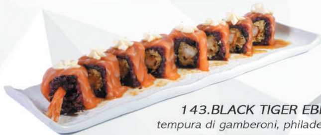
143.BLACK TIGER EBI tempura di gamberoni, philadelphia, sopra salmone, salsa teriyaki €12,00

ROLLS DI RISO NERO RIPIENI DI PESCE - 8PZ