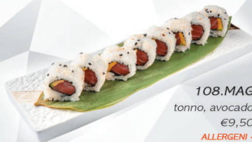
108.MAGURO tonno, avocado, sesamo €9,50 ALLERGENI 4,11