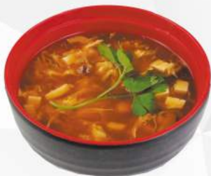
241 ZUPPA AGROPICCANTE pollo, bambù, funghi, carote, piccante €3,00 ALLERGENI 1,6