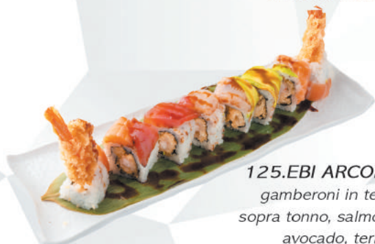
125.EBI ARCOBALENO gamberoni in tempura, sopra tonno, salmone, orata, avocado, teriyaki €13,00 ALLERGENI 1,2,4,6