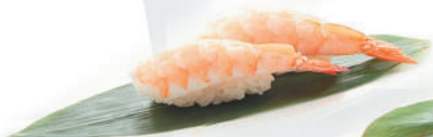
34.GAMBERO COTTO gambero cotto €3,00 ALLERGENI 1,2