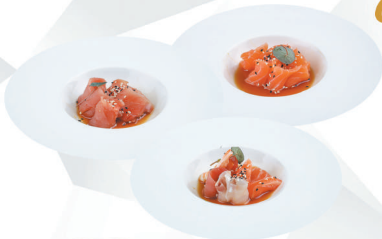
72.SAKE ALLERGENI 1,4,6,11 salmone, sesamo, salsa ponzu €7,00

PESCE TAGLIO FINE 3pz - menù alla carta 8pz