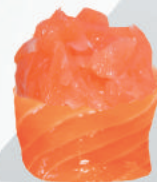
57. SAKE tartare di salmone, avvolto da salmone €4,00 ALLERGENI 4