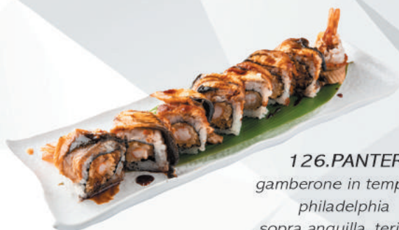
126.PANTER gamberone in tempura, philadelphia sopra anguilla, teriyaki €14,00 ALLERGENI 1,2,4,6,7