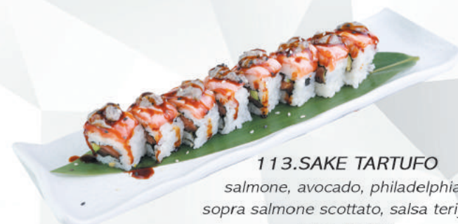
113.SAKE TARTUFO salmone, avocado, philadelphia, sopra salmone scottato, salsa teriyaki salsa tartufo €11,00 ALLERGENI 1,4,6,7,11