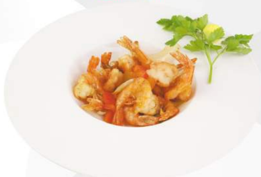
270 GAMBERI SALE E PEPE gamberi, cipolla, peperoni, porro, sale e pepe €6,50 ALLERGENI 2