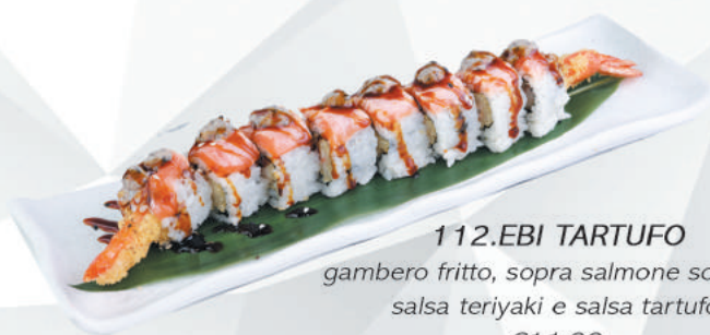
112.EBI TARTUFO gambero fritto, sopra salmone scottato, salsa teriyaki e salsa tartufo €11,00 ALLERGENI 1,2,4,6,11