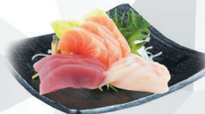
71. MISTO - 10PZ salmone, tonno, orata €10,00 ALLERGENI 4