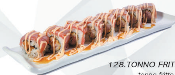
128.TONNO FRITTO ROLL tonno fritto, sopra tonno scottato, spicy, teriyaki €10,00 ALLERGENI 1,4,6