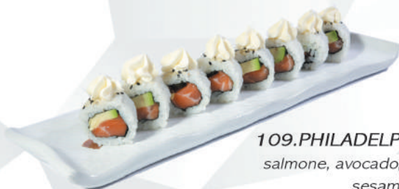
109.PHILADELPHIA ROLL salmone, avocado, philadelphia sesamo €9,50 ALLERGENI 4,7,11