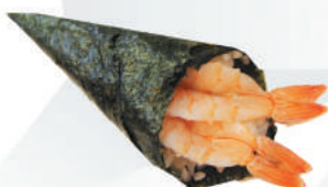
46.GAMBERO COTTO gambero cotto, avocado, sesamo €2,50 ALLERGENI 1,2,11