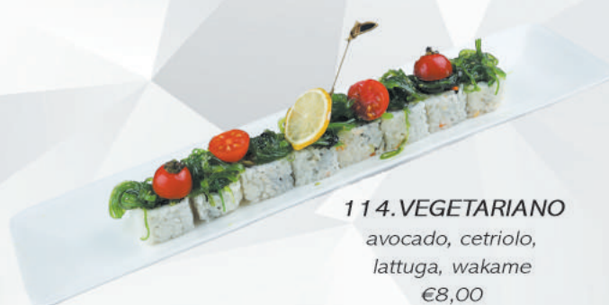
114.VEGETARIANO avocado, cetriolo, lattuga, wakame €8,00