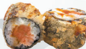
104.TEMPURA SALMONE salmone tutto in tempura, teriyaki €4,00 ALLERGENI 1,4,6,7