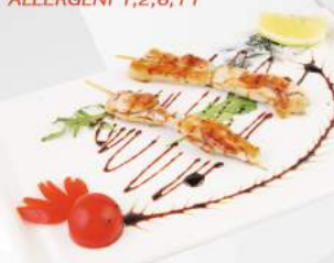
279 Spiedini di Pollo €4,00 2pz - menù alla carta 3 spiedini ALLERGENI 1,6