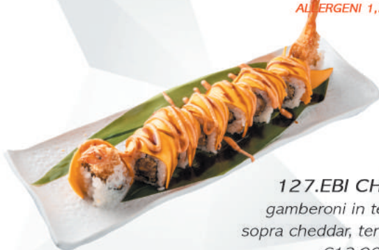
127.EBI CHEESE gamberoni in tempura, sopra cheddar, teriyaki, spicy €12,00 ALLERGENI 1,2,6