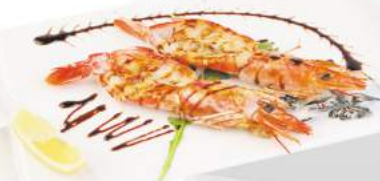
276 Gamberoni alla piastra €7,00 gamberoni, teriyaki, sesamo 2pz - menù alla carta 4pz ALLERGENI 1,2,6,11