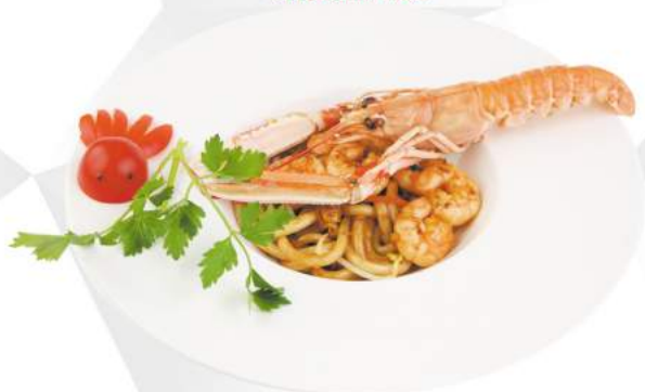
238 YAKI UDON zucchine, carote, cipolle, porro, uovo, gamberi €8,00 ALLERGENI 1,2,3,6