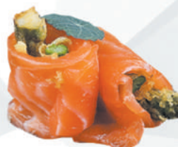
64.SAKE ASPARAGI asparagi, avvolto da salmone, teriyaki €4,50 ALLERGENI 1,4,6