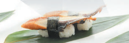
36.ANGUILLA anguilla, teriyaki €4,00 ALLERGENI 1,4,6