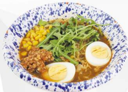
236 RAMEN ZUPPA manzo, mais, rucola, uovo €6,00 ALLERGENI 1,3,6