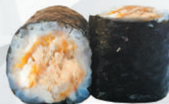
102.MIURA salmone cotto, teriyaki €4,00 ALLERGENI 1,4,6