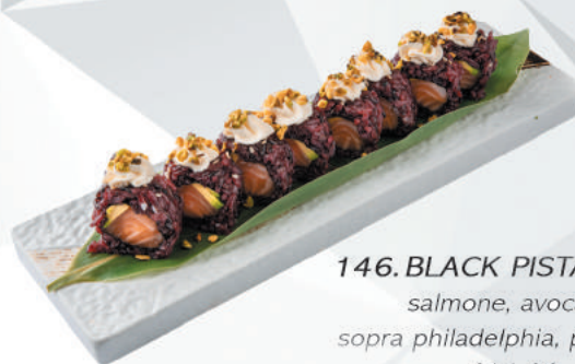
146.BLACK PISTACCHIO salmone, avocado sopra philadelphia, pistacchio €11,00