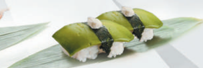
37.AVOCADO avocado €2,50 ALLERGENI 7