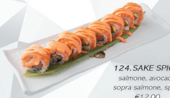
124.SAKE SPICY salmone, avocado sopra salmone, spicy €12,00 ALLERGENI 1,4