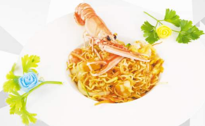
237 RAMEN PIASTRA zucchine, carote, cipolla, porro, gamberi, calamari, surimi, uovo €6,00 ALLERGENI 1,2,3,6,14