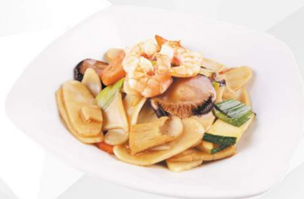
239 GNOCCHI DI RISO carote, zucchine, funghi, cipolla, uova, gamberi €5,00 ALLERGENI 1,2,3,6