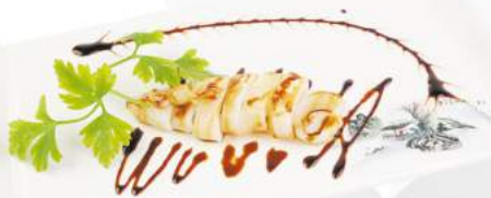
280 Calamaro alla piastra €7,00 calamaro, teriyaki, sesamo ALLERGENI 1,4,6