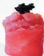
55.MAGURO SPICY tartare di tonno, mayo, tobiko, avvolto da tonno €5,00 ALLERGENI 1,2,4