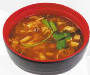
241 ZUPPA AGROPICCANTE pollo, bambù, funghi, carote, piccante €3,00 ALLERGENI 1,6