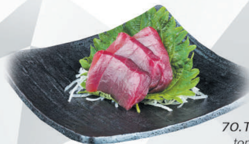
70.TUNA tonno €7,00 ALLERGENI 4