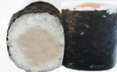
98.SUZUKI orata €4,00 ALLERGENI 4